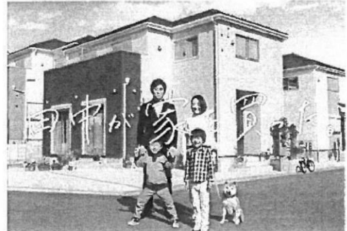
※当社CM画像です。建物については施工イメージとなります。

分譲住宅「リナーージュ」 時間を越えて、受け継がれていく住まいを。 LIGNAGEリナーージュはアイライフホームの住宅ブランド。 フランス語で「血統」を意味するこの名前には 「良質な住宅を供給し続ける」という私たちの 企業ポリシーを正統に受け継ぐ住まいであることを表しています。