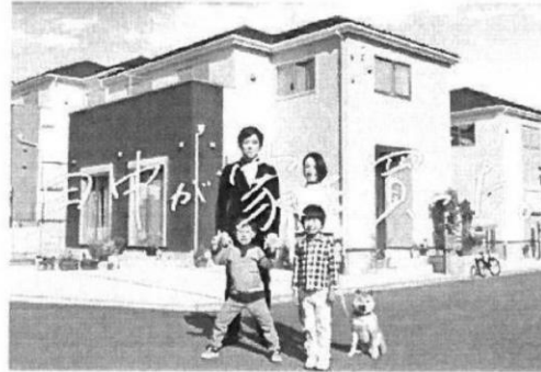
※当社CM画像です。建物については施工イメージとなります。

分譲住宅「リナージュ」 時間を越えて、受け継がれていく住まいを。 LIGNAGEリナージュは、アイライフホームの住宅ブランド。 フランス語で「血統」を意味するこの名前は、 「良質な住宅を提供し続ける」という私たちの 企業ポリシーを正統に受け継ぐ住まいであることを表しています。