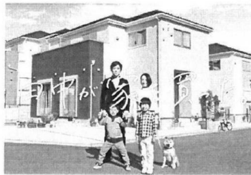
※当社CM画像です。建物については施工イメージとなります。

分譲住宅「リナーージュ」 時間を越えて、受け継がれていく住まいを。 LIGNAGEリナーージュは、アイディホームの住宅ブランド。 フランス語で「血統」を意味するこの名前は、 「良質な住宅を提供し続ける」という私たちの 企業ポリシーを正統に受け継ぐ住まいであることを表しています。