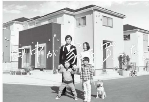
※当社CM画像です。建物については施工イメージとなります。

分譲住宅「リナージュ」 時間を超えて、受け継がれていく住まいを。 LIGNAGE(リナージュ)は、アイライフホームの住宅ブランド。 フランス語で「血統」を意味するこの名前は、「良質な住宅を提供し続ける」という私たちの企業ポリシーを正統に受け継ぐ住まいであることを表しています。