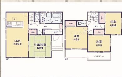
【2号棟外観・間取り】