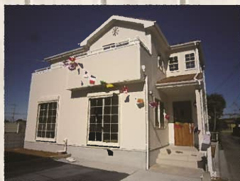
【1号棟外観・間取り】