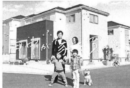
※当社CM画像です。建物については施工イメージとなります。

分譲住宅「リナージュ」 時間を越えて、受け継がれていく住まいを。 LIGNAGE(リナージュ)は、アイディホームの住宅ブランド。 フランス語で「血統」を意味するこの名前には、 「良質な住宅を提供し続ける」という私たちの 企業ポリシーを正統に受け継ぐ住まいであることを表しています。