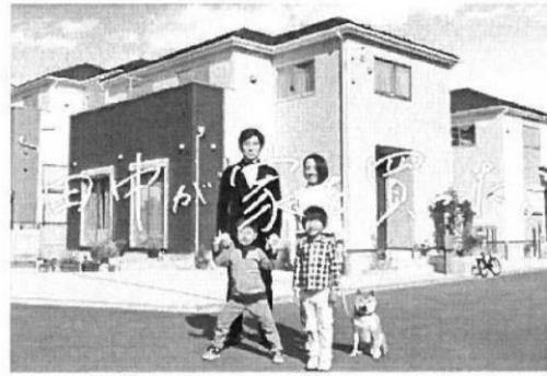
※当社CM画像です。建物については施工イメージとなります。

分譲住宅「リナーージュ」 時間を超えて、受け継がれていく住まいを。 LIGNAGE(リナーージュ)は、アイライフホームの住宅ブランド。 フランス語で「血統」を意味するこの名前には、 「良質な住宅を提供し続ける」という私たちの 企業ポリシーを正統に受け継ぐ住まいであることを表しています。