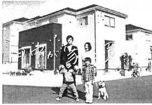
※当社CM画像です。建物については施工イメージとなります。

分譲住宅「リナーージュ」 時間を超えて、受け継がれていく住まいを。 LIGNAGEリナーージュは、アイライフホームの住宅ブランド。 フランス語で「血縁」を意味するこの名前には、 「高質な住宅を提供し続ける」という私たちの 企業ポリシーを正統に受け継ぐ住まいであることを表しています。