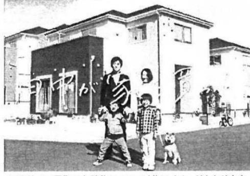
※当社CM画像です。建物については施工イメージとなります。

分譲住宅「リナーージュ」 時間を超えて、受け継がれていく住まいを。 LIGNAGEリナーージュは、アイライフホームの住宅ブランド。 フランス語で「血縁」を意味するこの名前は、 「高質な住宅を提供し続ける」という私たちの 企業ポリシーを正統に受け継ぐ住まいであることを表しています。