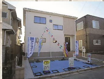
【1号棟現地外観・間取り】