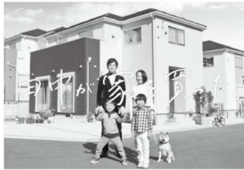
※当社CM画像です。建物については施工イメージとなります。

分譲住宅「リナージュ」 時間を越えて、受け継がれていく住まいを。 LIGNAGE(リナージュ)は、アイライフホームの住宅ブランド。 フランス語で「血統」を意味するこの名前は、「良質な住宅を提供し続ける」という私たちの企業ポリシーを正統に受け継ぐ住まいであることを表しています。